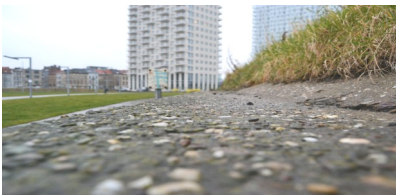
De weg bewandelen van forensisch cliënt naar vrije burger.

In dit zorgnetwerk worden zowel het reguliere als het forensische circuit betrokken. Invalshoek hierbij is de woon - en leefsituatie. De zorg verloopt regulier waar kan, categoriaal waar nodig.